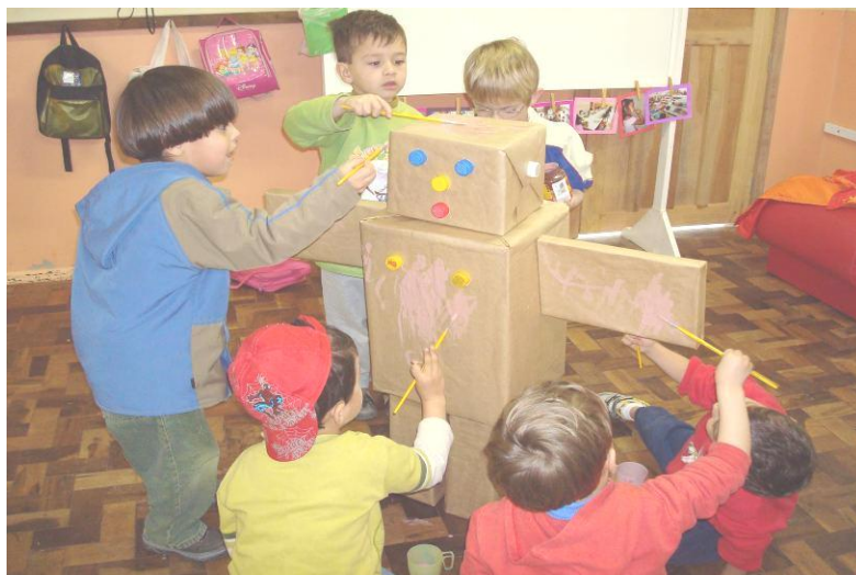
PINTANDO O BONECO – MENINO