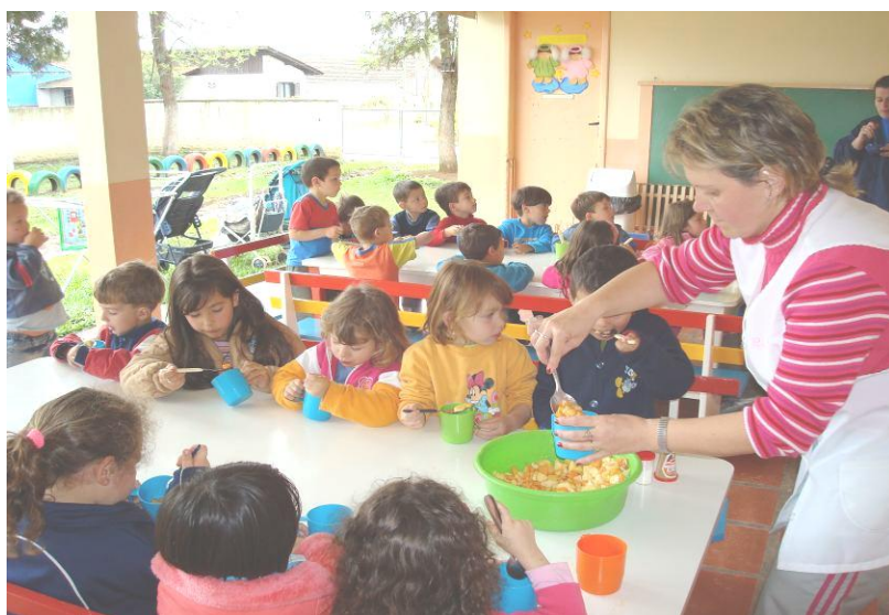
HORA DA REFEIÇÃO – COMENDO A SALADA DE FRUTA