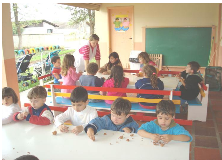
CONSTRUINDO ESCULTURA HUMANA