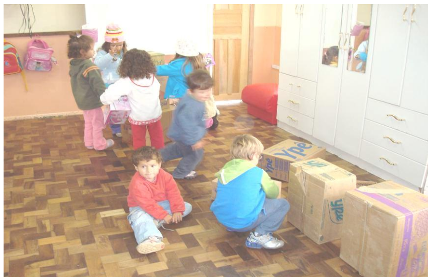
ESCOLHA DAS CAIXAS PARA CONFECÇÃO DO BONECO ROBÔ