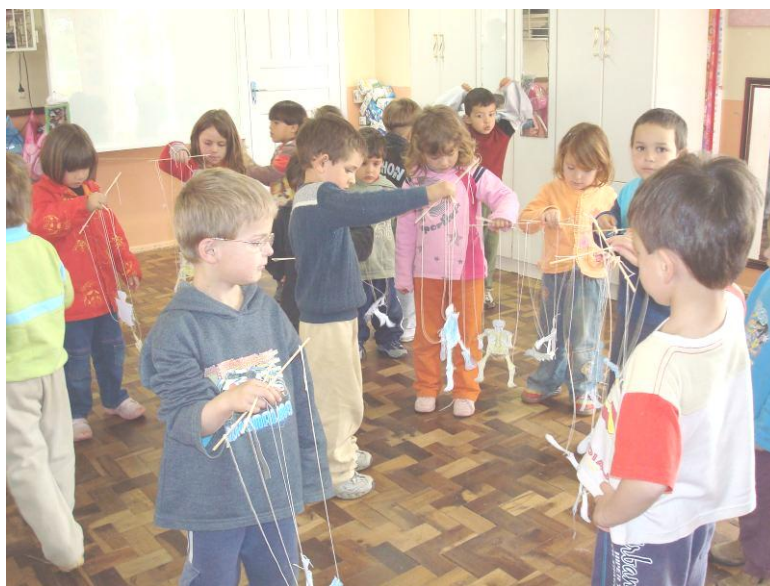
BRINCANDO COM A MARIONETE - ESQUELETO