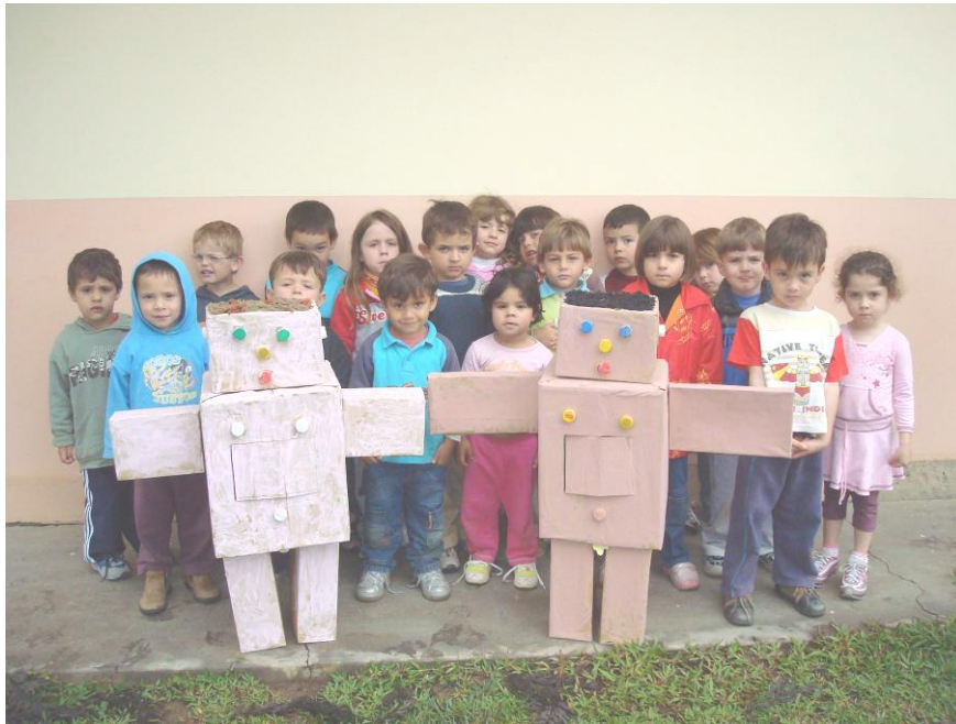
REPRODUÇÃO FINAL DOS BONECOS – ROBÔS