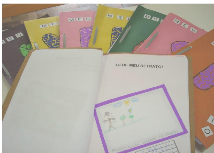
ALGUMAS DAS ATIVIDADES DO TEMA CORPO HUMANO JÁ ESTÃO ANEXADAS NO PORTFÓLIO.