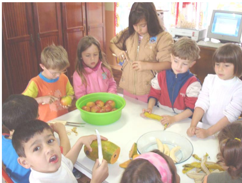
CORPO SAUDÁVEL – OFICINA CULINÁRIA – SALADA DE FRUTA