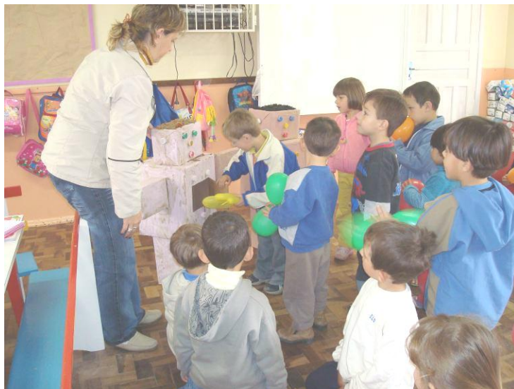
BRINCANDO COM OS COM OS ORGÃOS – O QUE TEMOS DENTRO DO CORPO