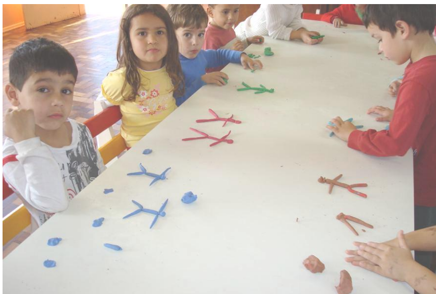
BRINCANDO COM MASSINHA – CONSTRUINDO O CORPO HUMANO