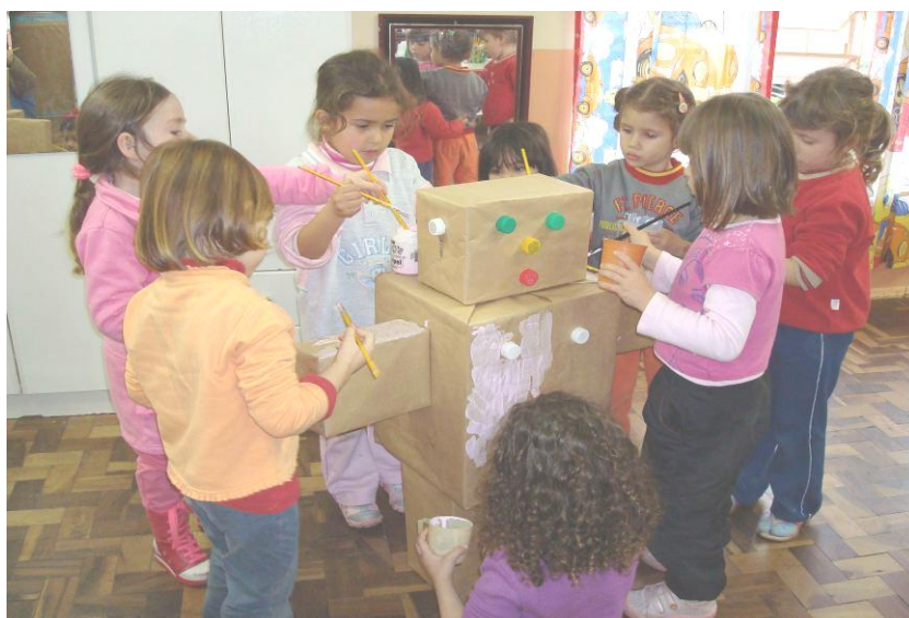
PINTANDO O BONECO – MENINA